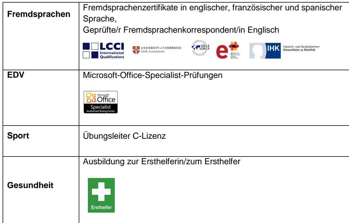
Abbildung 3: Übersicht der Zertifikate und Zusatzqualifikationen

Zusätzlich bieten wir unseren Schülerinnen und Schülern die Möglichkeit, anerkannte Zertifikate und Zusatzqualifikationen in verschiedenen Schwerpunkten zu erwerben: