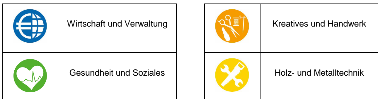
Abbildung 2: Schulische Schwerpunkte bzw. berufliche Bereiche

Die allgemeinbildenden Abschlüsse – Hauptschulabschluss [HS 9/10], Fachoberschulreife [FOR], Fachhochschulreife [FHR], Allgemeine Hochschulreife [AHR] – können mit diversen beruflichen Qualifikationen (berufliche Kenntnisse oder Berufsabschlüsse) gekoppelt sein und in folgenden vier Bereichen erworben werden: